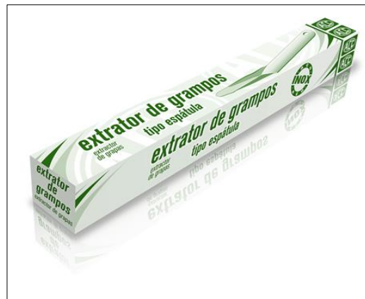
Embalaje para 1 unidad