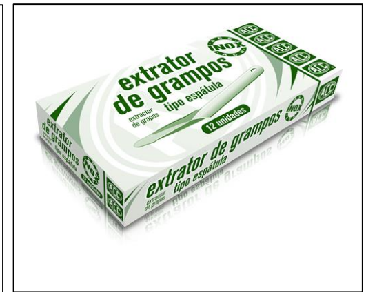
Embalaje para 12 unidades